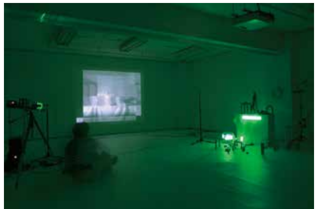
藤幡正樹 《ルスカの部屋》 2004 インスタレーション