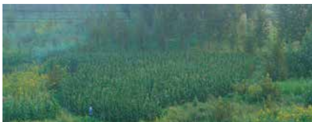
潘逸舟 《トウモロコシ畑を編む》 2021 2チャンネルビデオ、サウンドインスタレーション