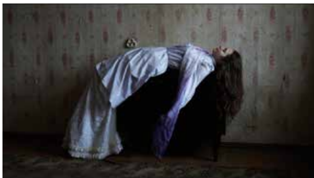
山元彩香 《organ #1 "Marta", Latvia》 2019 シングルチャンネルビデオ