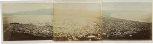
作家不詳 函館港全景 明治25年頃 鶏卵紙