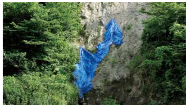
小森はるか+瀬尾夏美 《山つなみ、雨間の語らい》 2021 インスタレーション(写真、映像、サウンド、鉛筆、紙、水彩、アクリル、テキスト、資料)