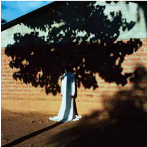
山元彩香 《Untitled #320, Mzimba, Malawi》〈We are Made of Grass, Soil, Trees, and Flowers〉 2019 発色現像方式印画