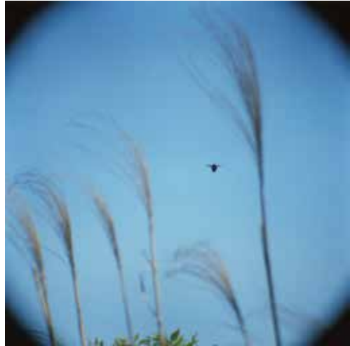
野口里佳 《クマンバチ #3》 2019 発色現像方式印画